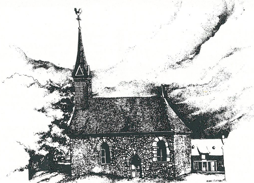
Chapelle de Saint-Laurent

Modeste, elle dresse son clocher dans un îlot de verdure, rivalisant avec les vieux chênes et le vieil if. Construite à la fin du siècle dernier, dans les années 1860, elle illustre la volonté farouche des gens du pays de lui conserver son caractère; 125 ans plus tard, elle fait l'objet de la même attention et de la même inquiétude: