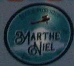
Photo : Plaque de l'école primaire de Paimpont.