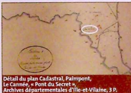
Détail du plan Cadastral, Paimpont, Le Cannée, « Pont du Secret », Archives départementales d'Ille-et-Vilaine, 3 P.