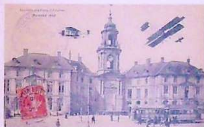
Photos - Rennes-Aviation, 1910.

L'essor de l'aviation et le succès des premières fêtes de l'aviation comme à Reims en 1909 incitent les principales villes de province à organiser leur propre fête aérienne. Les premières fêtes de l'aviation de Rennes se déroulent en 1910. La ville ne disposant pas encore de l'aérodrome de Saint-Jacques-de-la-Lande - inauguré en 1933 -, c'est l'hippodrome des Gayeulles qui est choisi pour accueillir la manifestation. Les plus grands aviateurs répondent présents : Roland Garros, Émile Obre, Paul de Lesseps... Les avions sont acheminés, démontés dans des caisses posées sur des charrettes. Les conditions de vol sont difficiles et de nombreux pilotes perdent le contrôle de leur appareil.