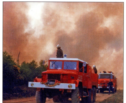
Les soldats du feu aux prises avec les flammes à Sainte-Anne, dans les landes rennaises. En haut : le feu dans le Val sans Retour.