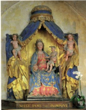
Notre-Dame de Paimpont, si accueillante.