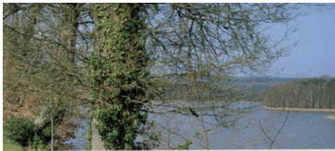
L'ancienne abbaye, vue du côté est, et l'étang.