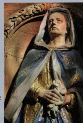
Sainte Monique ou la Mère des douleurs ?