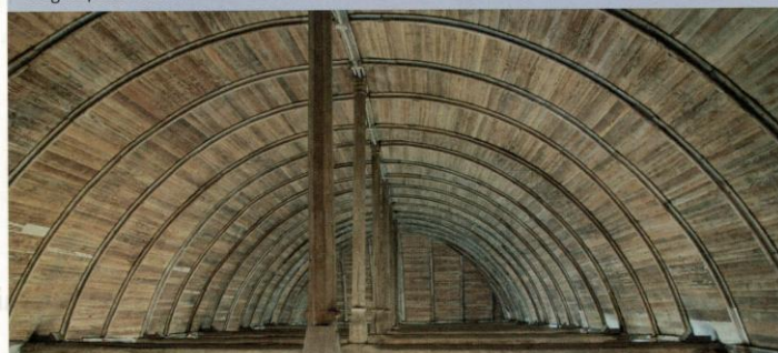
Le lambris de la nef.