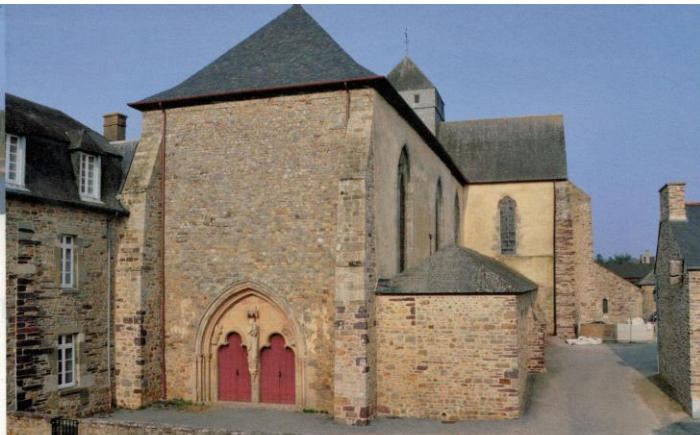
L'église, côté ouest.

■ Y a-t-il un intérêt particulier à ce que le mobilier contemporain soit en fer forgé ? À bientôt !